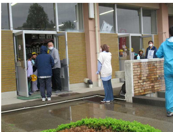
(親園小学校の様子)