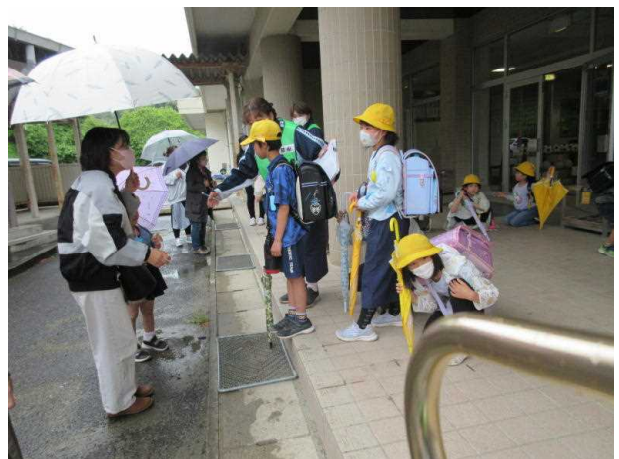
(佐久山小学校の様子)