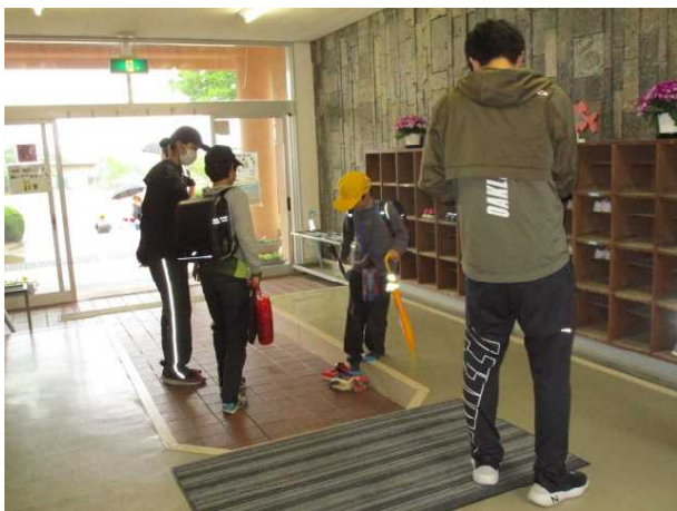
(宇田川小学校の様子)

親園中学校区では、大地震などの大規模災害を想定して小中合同引き渡し訓練を実施しました。実際に大規模災害が起こった際に、円滑に児童生徒をご家族に引き渡すために、災害発生時刻を合わせたり送迎ルートを指定したりして各小中学校が連携して計画を作成しました。中には小学校・中学校両方の送迎をされた方もいてお手数をおかけしましたが、保護者の皆様のご協力により大きな混乱はなく児童生徒を引き渡すことができ、学校でもいざというときの対処法を確認できました。ありがとうございました。