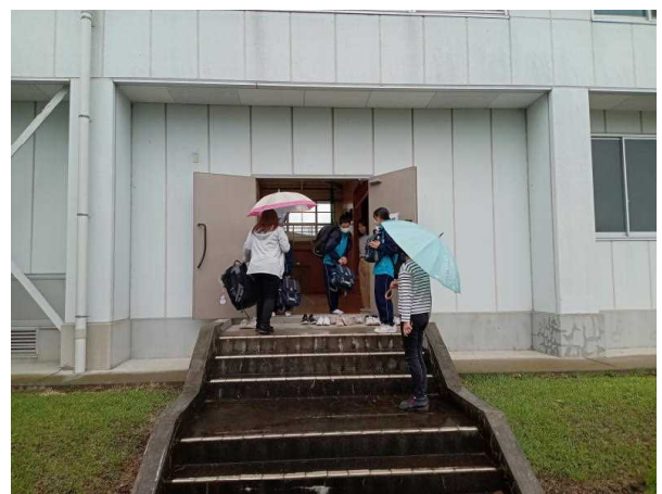
(親園中学校の様子)